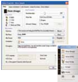
Das Hauptfenster des Button Manager 2

Mit dem Avision Button Manager 2 können komplexe Scanvorgänge mit nur einem Tastendruck erledigt und direkt an die gewünschte Zielanwendung gesendet werden.