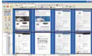
Das AvScan 5.0 Hauptfenster

Die Digitalisierung von Dokumenten ist der erste Schritt vom eigentlichen Dokumenten - Managment. Allerdings kann schlechte Bildqualität der Grund für Probleme beim späteren Einordnen oder Speicherung der Dokumente bedeuten. Dies treibt die Arbeitskosten in die Höhe und vermindert die OCR Fehlerfreiheit. AVScan 5.0 gewährleistet, daß alle Dokumente überprüft und aufgearbeitet sind, noch während sie verarbeitet werden, so daß die Bildqualität gesichert ist bevor sie für andere Anwendungen bereit stehen. AvScan 5.0 ist eine intelligente Scan- und Speicherlösung. Mit verschiedenen Funktionen bereitet AVScan die Information als elektronischen Dateien für die Archivierung auf.