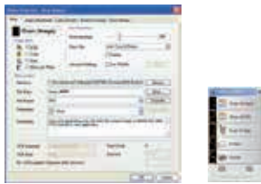
Der Avison Button Manager V2

Das Button Manager V2 erleichtert das Scannen und Versenden von Bilddateien an favorisierte Speicherablagen mit einem Tastendruck. Die neue Innovation mit integriertem Ablagespeicher ist kompatibel zu weiteren Anwendungen wie das Google Docs, Microsoft SharePoint und FTP-Server. iScan erkennt mit Hilfe des OCR (Optical Character Recognition) den Textinhalt und macht es dem Benutzer leicht durch Texterkennung den Inhalt des Dokuments zu verwalten.