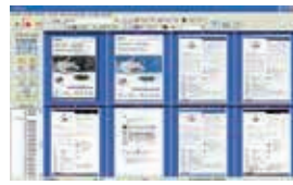
Der AVScan X Vollbild

Dokumentenerfassung ist der erste Schritt des Dokumentenmanagements. Nur autorisierte Scandokumente werden lesbar wiederverwendet. Schlechte Auflösung und Bildqualität verursachen einen erhöhten Aufwand und senken die OCR-Genauigkeit. AVScan X sichert sämtliche Dokumente in ihrer gewählten Einstellung, um für den späteren Gebrauch zur Verfügung zu stehen. AVScan X als intelligentes Scannen und elektronische Datensicherungsanwendung verspricht eine einfache Handhabung zur Sicherung von Dokumentensätzen.